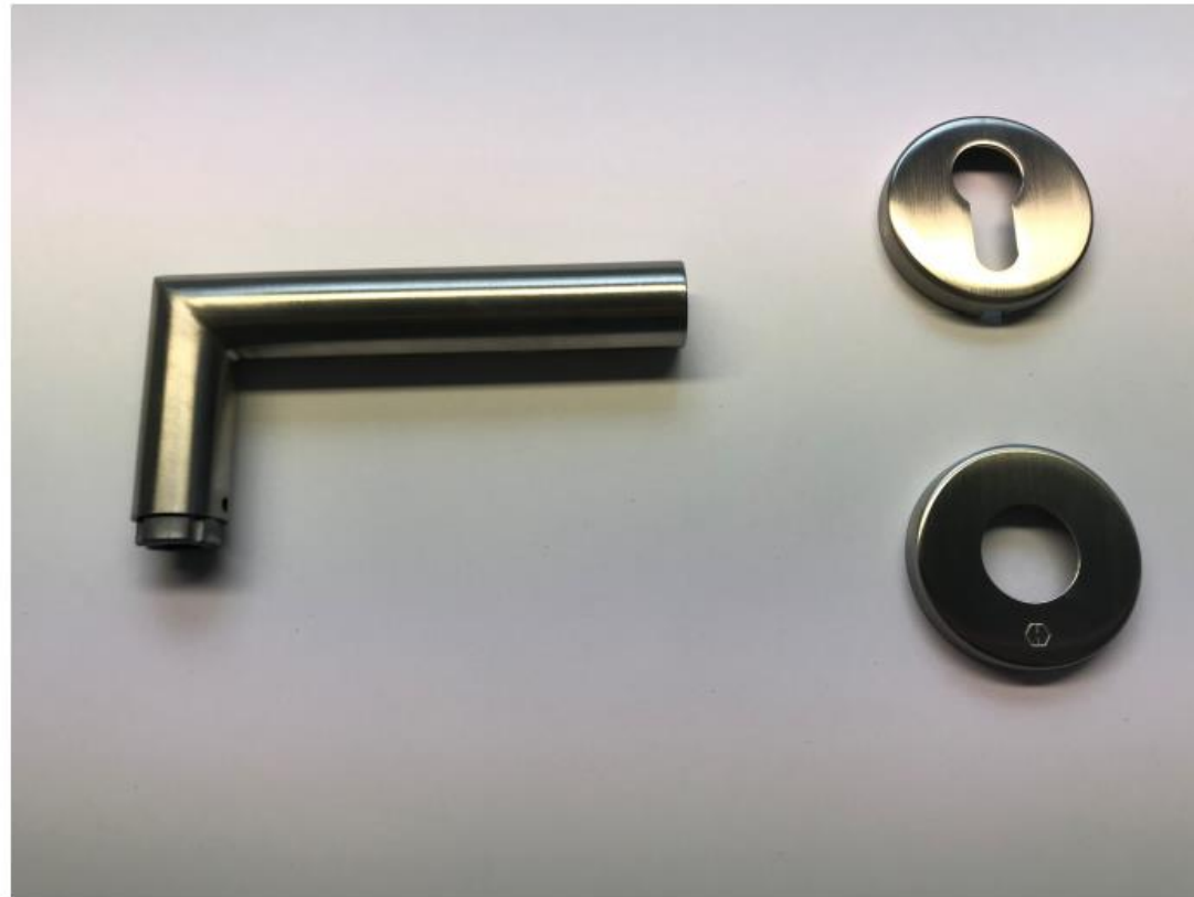
Zimmertür-Garnitur Hoppe „Amsterdam“